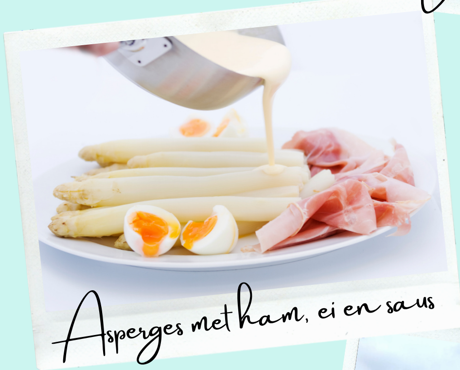
Asperges met ham, ei en saus