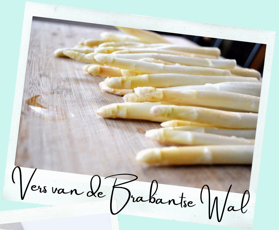
Vers van de Brabantse Wal