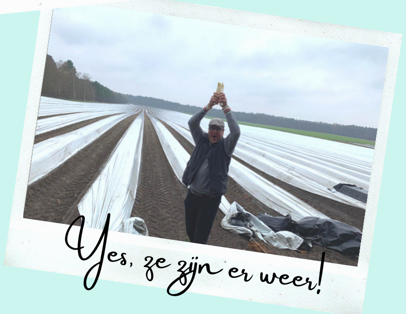
Yes, ze zijn er weer!